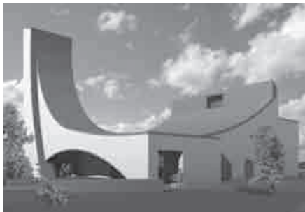
Due immagini del progetto della nuova chiesa dell'Immacolata Concezione al Maristella: a sinistra la visione esterna e a destra l'aula liturgica